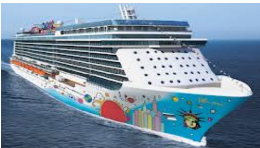
Barcos de turismo y de carga.