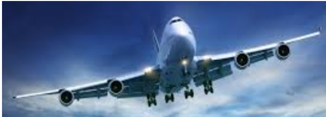
Aviones comerciales, privados y de la Fuerza Aérea.